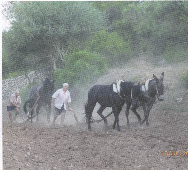
📍 Exemple d'ús tradicional del cavall: llaurant el camp de Menorca amb dos cavalls i un ase. (Família Pons Marquès)

amb soltesa responnent a les ordres del genet.