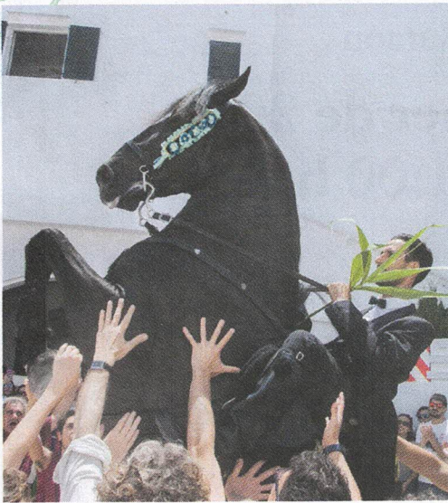
El cavall, principal protagonista de les festes religiós-cavalleresques de Menorca.