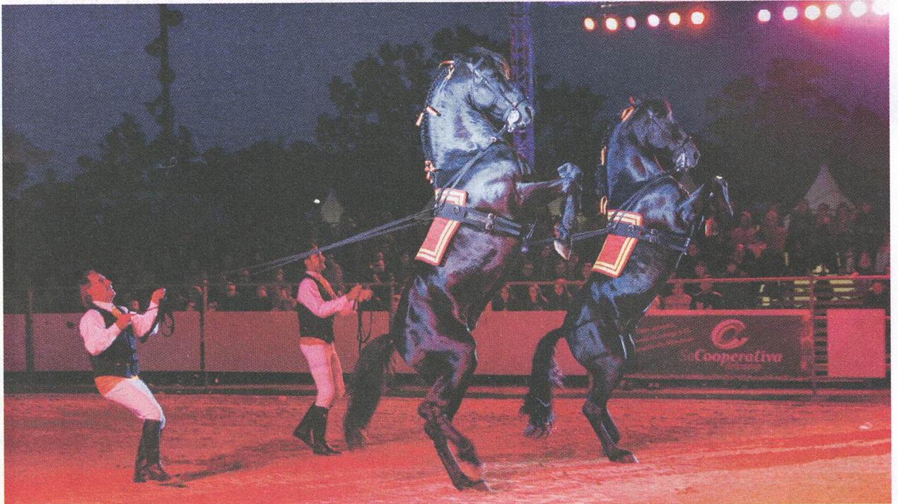
Espectacle de la Fira del Cavall de Raça Menorquina

Per l'Associació de Criadors i Propietaris de Cavalls de Raça Menorquina