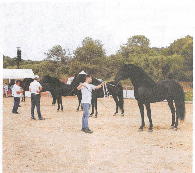
Participació a la final del Campionat d'Espanya de Cavalls Joves de Doma Clàssica 2019. (Alberto Martínez Bracero)

força i destresa: treballava la terra estirant de l'arada, pujava sobre l'era per batre (batre a potes), arrossegava càrregues pesades, cavalcava pel lloc com a mitjà de transport del pagès o per recollir el bestiar, i estirava del carro per desplaçar tant a les persones com a les mercaderies als diferents pobles de l'illa.