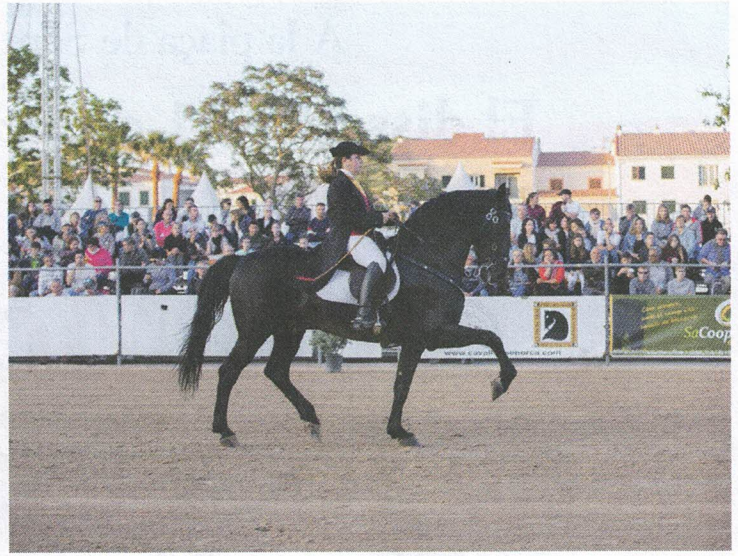
La Doma Menorquina és una disciplina típica de Menorca amb origen a les festes populars.

També, diferents ramaderies i centres hípics han diversificat els usos del cavall i ofereixen a dia d'avui passejades i rutes eqüestres per tota l'illa, aprofitant el conegut Camí de Cavalls, un sender que envolta Menorca i que va ser concebut en els seus inicis com un camí per facilitar el desplaçament i la defensa de l'illa. Però que avui en dia fa les delícies d'excursionistes, ciclistes i genets, que gaudeixen del paisatge de Menorca i els seus contrastos de terra i mar.