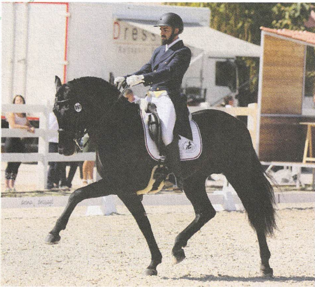
Concurs morfològic anual de Cavalls de Raça Menorquina. Recinte Firal d'Es Mercadal. (Reset Events)